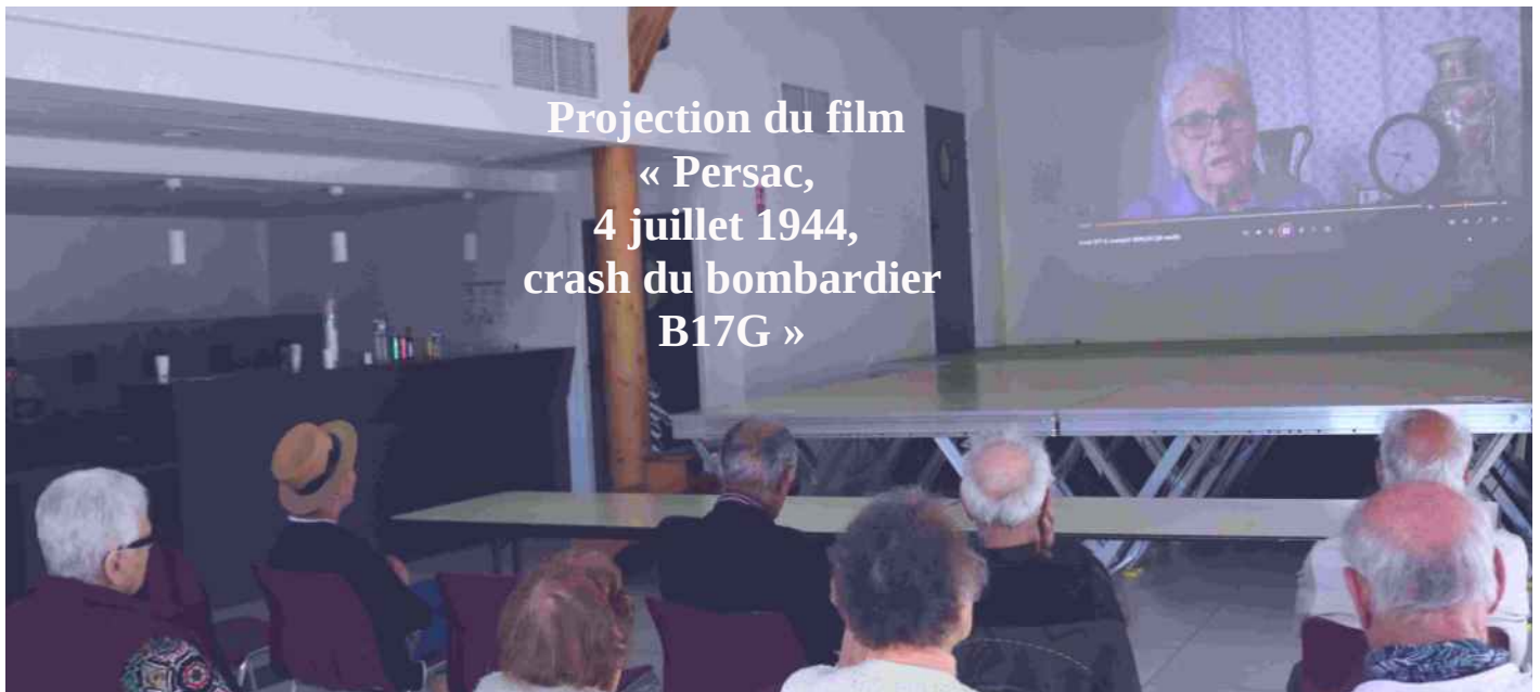
Projection du film « Persac, 4 juillet 1944, crash du bombardier B17G »