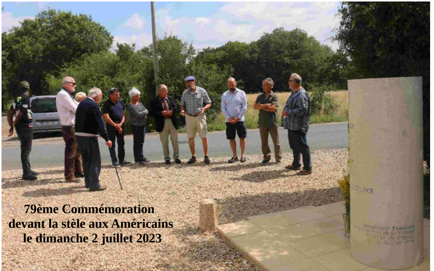
79ème Commémoration devant la stèle aux Américains le dimanche 2 juillet 2023