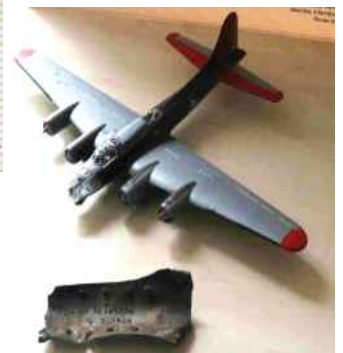
Maquette et morceau de fuselage (collection Pierre Champion)