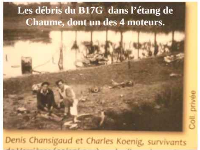
Les débris du B17G dans l'étang de Chaume, dont un des 4 moteurs.