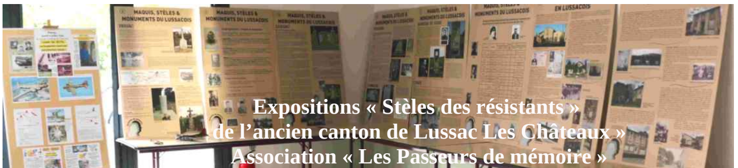
Expositions « Stèles des résistants » de l'ancien canton de Lussac Les Châteaux » Association « Les Passeurs de mémoire »