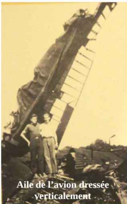
Aile de l'avion dressée verticalement