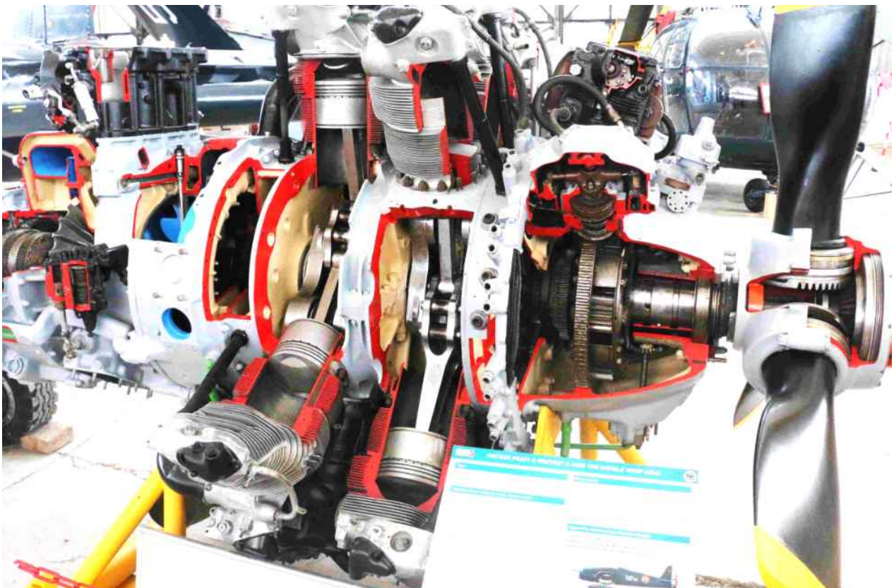
Coupe animée d'un moteur d'avion Pratt & Whitney R2800 10 (double wash » USA à 18 pistons en double étoiles (deux rangées de 9 accouplées), refroidi par air, à injection d'eau, d'une cylindrée de 46 litres et d'une puissance de 2000cv. Il équipa plus d'une centaine de types d'avions militaires mais aussi les avions civils : Douglas DC6, Bréguet deux ponts, Canadair CL-215 Musée de l'aéronavale de Rochefort.