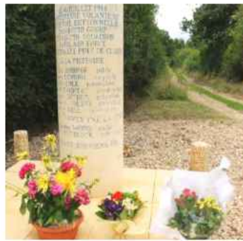
Stèle en hommage aux 9 jeunes aviateurs américains disparus.