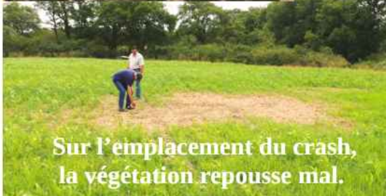
Sur l'emplacement du crash, la végétation repousse mal.